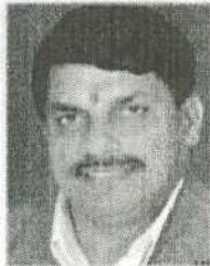
Dr. Mohan Yadav, Hon'ble Minister, Higher Education, M.P.