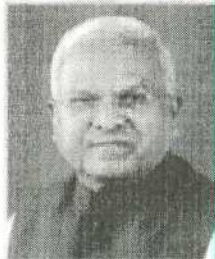
Shri Mangubhai Patel, Hon'ble Governor and Chancellor, M.P.